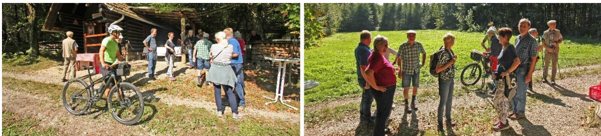
Gäste treffen ein

Auf 13.00 Uhr waren die Gäste geladen. Letzte Vorbereitungen wurden erledigt, Getränke und Essen warteten verzehrt zu werden.